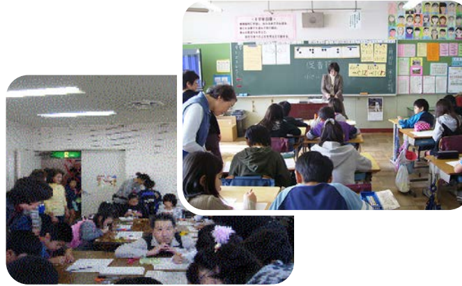
小学校、子供会の「点字体験」

自治会主催の点字教室で子供たちと 触れ合うと、とても興味をもってくれて 嬉しくなります