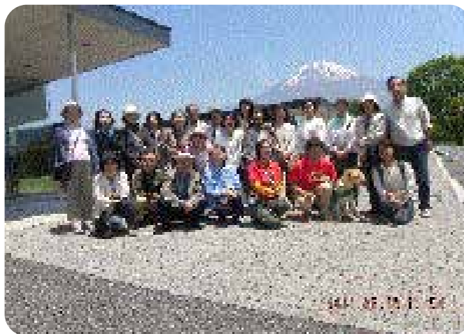
盲導犬センターを訪れた時