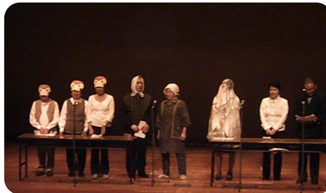
「文化の集い」で一緒に朗読劇