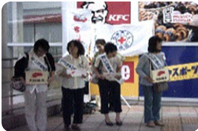
赤い羽根募金に参加して